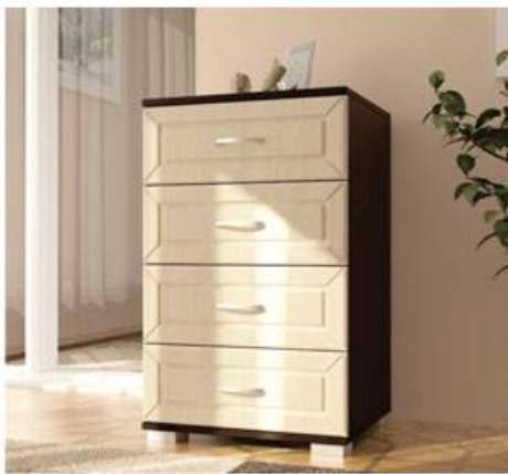
Комод МДФ №1 Д500хВ810хГ445мм