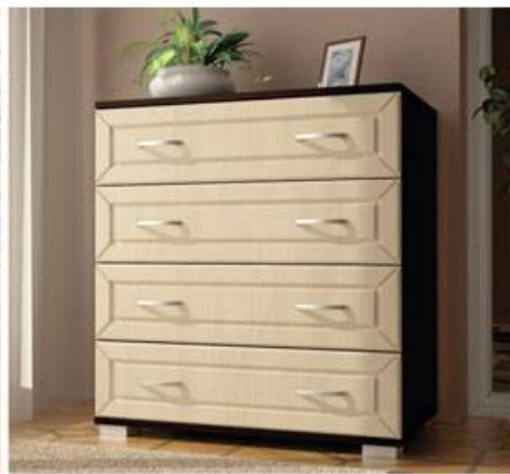
Комод МДФ №2 Д750хВ810хГ445мм