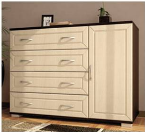
Комод МДФ №4 Д1100хВ810хГ445мм