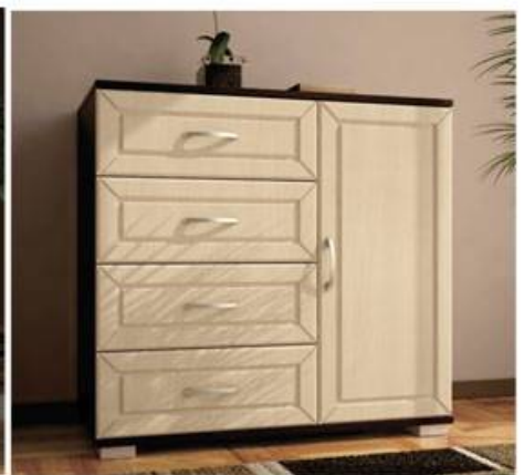
Комод МДФ №3 Д850хВ810хГ445мм