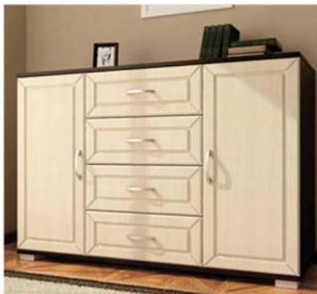
Комод МДФ №5 Д1200хВ810хГ445мм